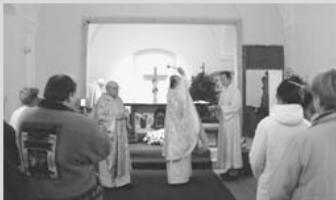
Požehnání zimní kaple na děkanství Třeboň dne 22. 11. 2009